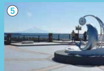
ノシャップ岬 夕日の美しい景勝地として知られ、眼前に秀峰尻富士や浮島礼文島、右手には宗谷岬を一望できます。