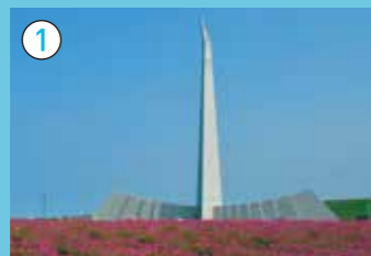
折りの塔 1983年9月、サハリン沖で起きた大韓航空機撃墜事件の遭難者の慰霊と恒久平和の願いを込めて建設されました。