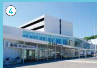
JR稚内駅・キタカラ 日本最北の駅で、駅と直結する複合施設「キタカラ」は、飲食、物販、映画館などで構成されています。