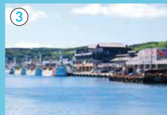
稚内副港市場 底曳漁業で多くの船が入り出していた第一副港に、かつての賑わいを取り戻そうと実現した観光・商業施設です。