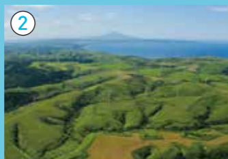
宗谷丘陵の周水河地形 (北海道遺産)と風車群 約1万年前まで続いた氷河期に形成された波のような地形で、この丘陵には57基の風車群が立ち並びます。