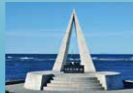
日本最北端の地の碑 宗谷岬の先端に位置し、まさに「日本のてっぺん」に建てられています。夜間はライトアップされ、幻想的となります。